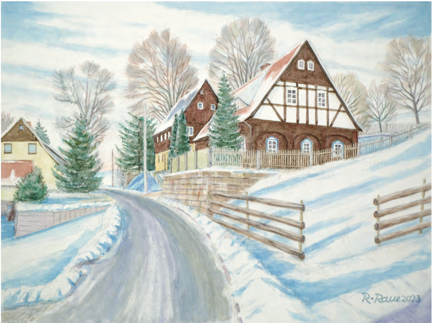
Aquarell von Roland Raue

Allen Einwohnern und Lesern der Oderwitzer Nachrichten wünscht die Gemeindeverwaltung Oderwitz und der Bürgermeister ein frohes Weihnachtsfest und einen guten Jahreswechsel.