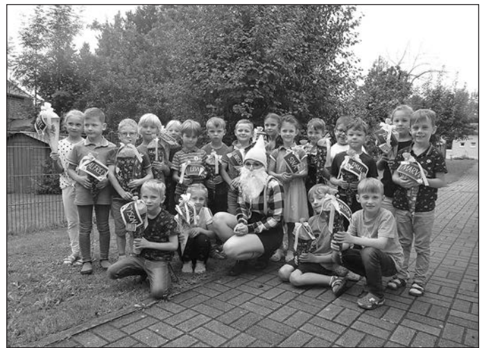
Das gesamte Kita-Team sagt auch DANKE für die tolle neue Bank unter der Linde in unserem Garten. Ein toller Ort zum Ausruhen, Beobachten und Bücher betrachten.

Mit unserem Zuckertütenfest beendeten die Vorschulkinder am 24. August ihre Kindergartenzeit. Wir bedanken uns bei allen ehemaligen Vorschulkindern für die erlebnisreiche, aufregende, spannende, lustige und lehrreiche, aber auch manchmal anstrengende Zeit. Wir bedanken uns bei den Eltern für ihr Vertrauen, die ehrlichen Gespräche und die gute Zusammenarbeit.