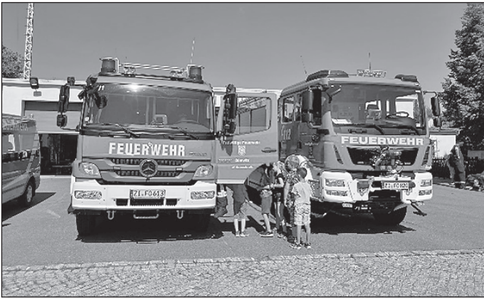
Besuch im Feuerwehrdepot Niederoderwitz