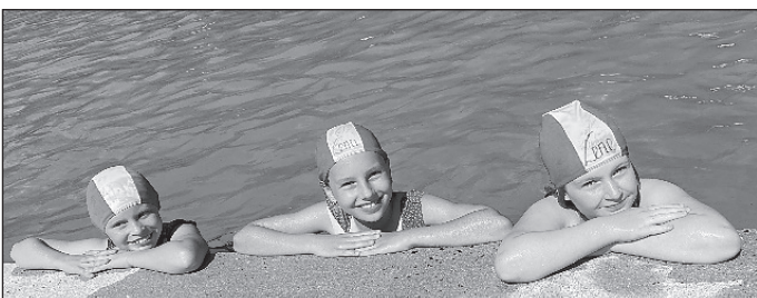
gemütlich chillen im Bad mit dem Jugendclub